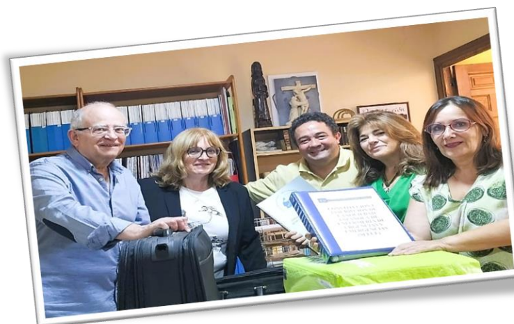
Traspaso de documentación de la SEEUE a la nueva Junta directiva SEEUE 2024

Sólo pretendo ver desde fuera del marco para reflexionar como ahora que me dais la oportunidad. Los elefantes ni a Europa. Los referentes lo son por ya no estar. La vida laboral y profesional tiene contaminantes y toxicidades propias de su espacio y tiempo, de las que los seniors han de ser preservados.