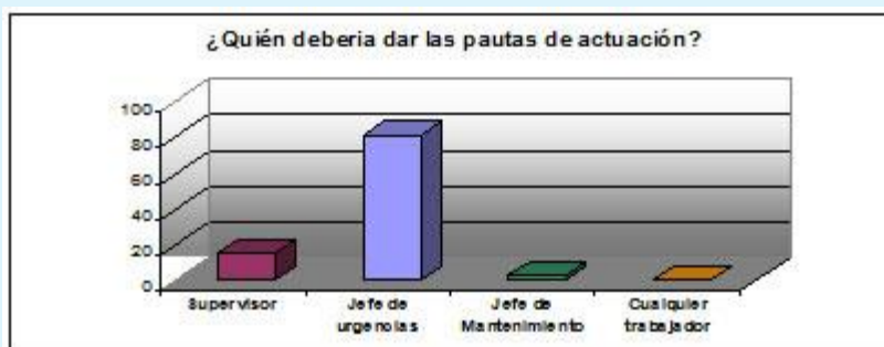
Gráfico 3. Tabla de porcentajes sobre pautas de actuación.

Para explorar los conocimientos de la cadena de mando ante Emergencias, les hemos preguntado sobre quien debería dar las pautas de actuación y nuestros resultados son: El Supervisor (15%), el jefe de urgencias (82 %), el jefe de mantenimiento (3 %), cualquier trabajador (0%).