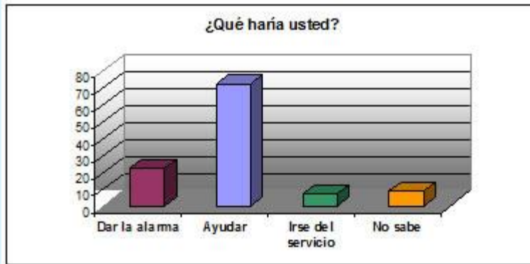
Gráfico 4. Tabla de porcentaje de actuación del personal ante un incendio

El 95% del Personal Sanitario del Servicio no ha usado nunca un extintor, mientras que el 5 % restante si lo ha hecho.