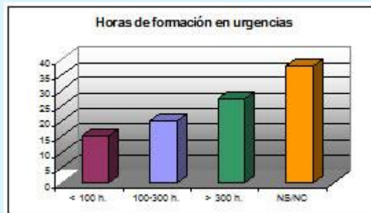
Gráfico 2. Tabla en porcentajes de horas de formación en urgencias

En el momento en que preguntamos al personal sanitario, sobre el conocimiento de las líneas de actuación de su servicio, principalmente ante un incendio, resulta que el 83 % desconoce dichas líneas, frente a un 17% que si las conoce o cree conocerlas.