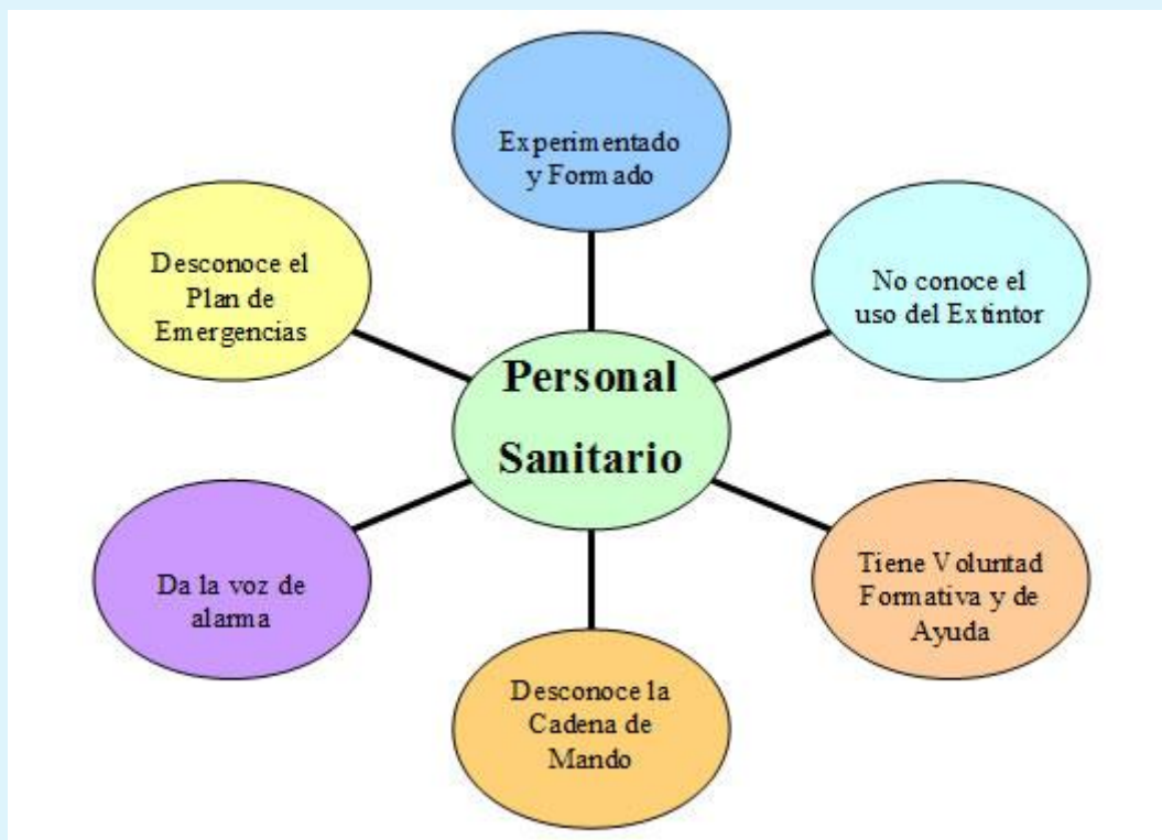
Gráfico de Conclusiones del Estudio