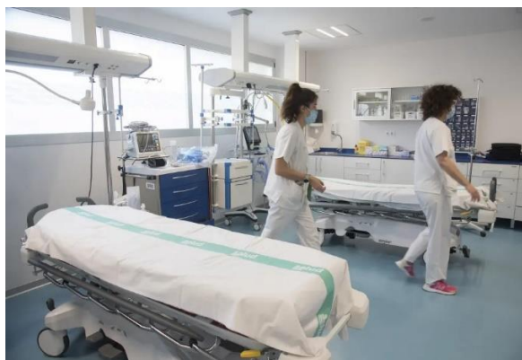
Urgencias Hospital de San Jorge