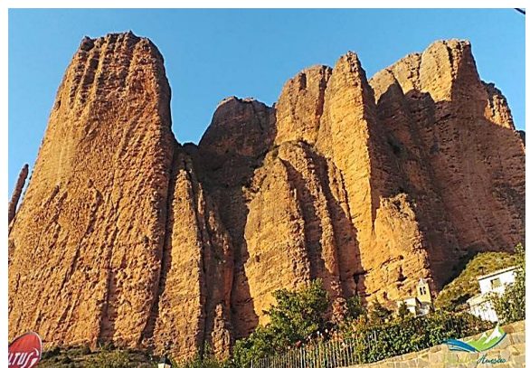
Los mallos de Riglos

La identidad oscense también se expresa a través de sus tradiciones como Las Fiestas de San Lorenzo , celebradas cada mes de agosto, tiñen la ciudad de blanco y verde y reflejan un espíritu colectivo que une generaciones en torno a la cultura, la música y la convivencia. Ese sentido de comunidad y pertenencia encuentra un paralelismo natural en el trabajo en equipo que caracteriza a la enfermería de emergencias.