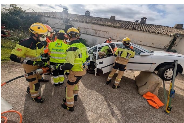
112 Sanidad de Aragón

Aunque dependiente de Zaragoza, el Hospital Universitario San Jorge, es el principal centro sanitario de la ciudad de Huesca, y es cabecera de la demarcación sanitaria de Huesca del Servicio Aragonés de Salud.