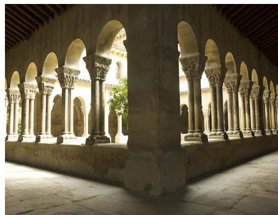
Claustro de la Iglesia de San Pedro el Viejo