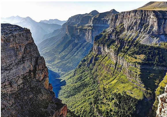
Parque Nacional de Ordesa

El entorno natural que rodea la ciudad añade un valor singular a la experiencia congresual. A menos de una hora se elevan los Pirineos y la sierra de Guara, con paisajes emblemáticos como el Parque Nacional de Ordesa y Monte Perdido, los Mallos de Riglos, formaciones únicas e inexplicables a los ojos del visitante, o enclaves históricos como el Castillo de Loarre, que recuerdan la importancia de la preparación, la anticipación y la resistencia ante los desafíos, valores profundamente vinculados al ámbito de las emergencias.